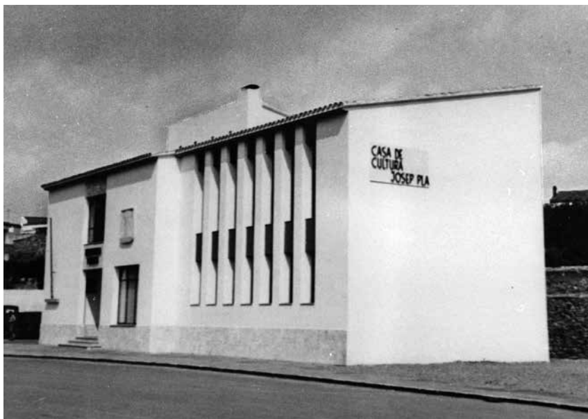
Fig.3. Edifici de la Biblioteca a l'Avinguda Josep Pla.