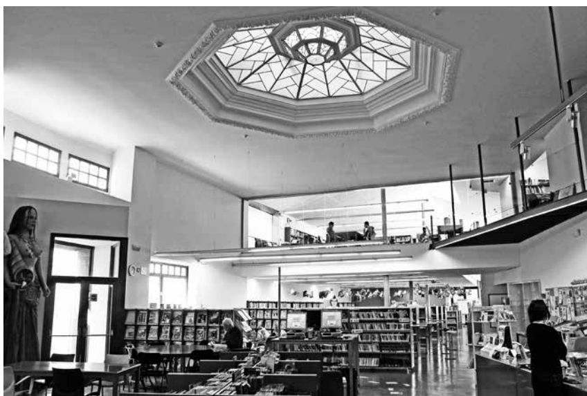
Fig. 5. Interior de la Biblioteca del carrer de Sant Martí.