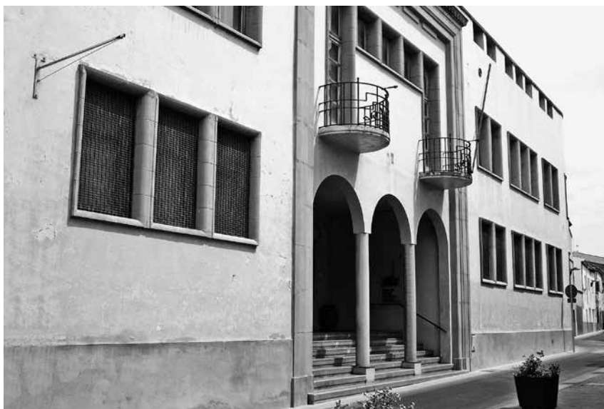
Fig.2. Façana de la biblioteca del carrer Tarongeta. Procedència: Biblioteca de Palafrugell. Col·lecció d'imatges.