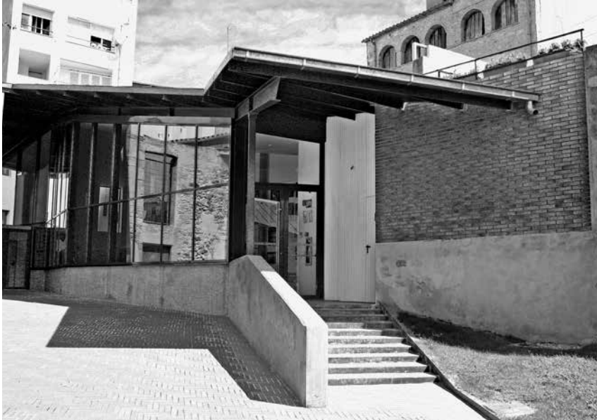
Fig. 8. La nova sala polivalent de la Biblioteca.

implicació i vocació, han fet possible que la Biblioteca de Palafrugell sigui el que és avui en dia: 10