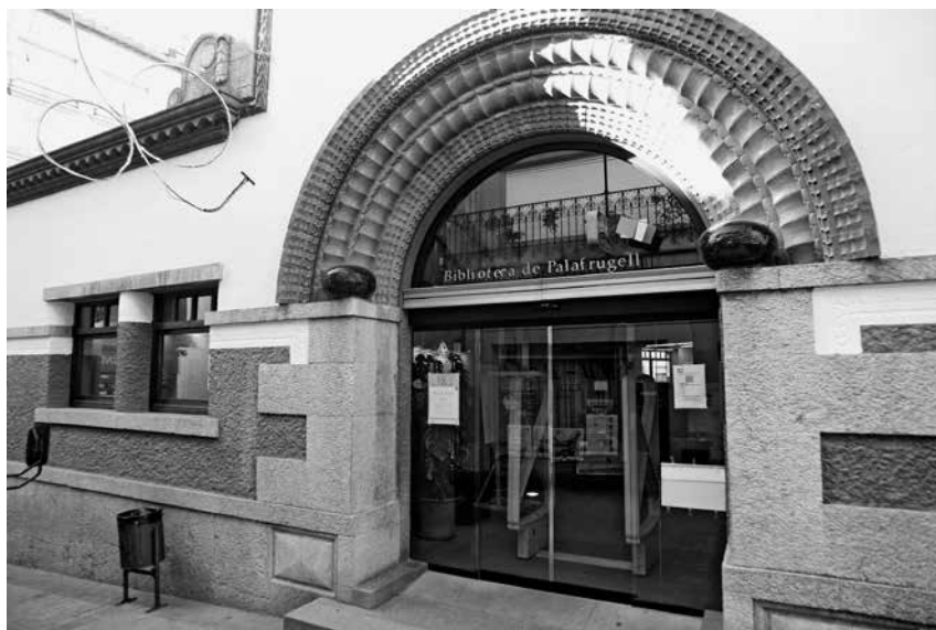
Fig.4. Façana de la Biblioteca del carrer de Sant Martí.